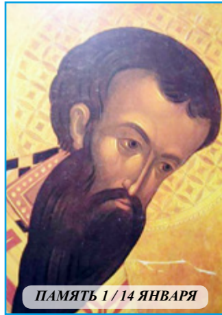
ПАМЯТЬ 1 / 14 ЯНВАРЯ